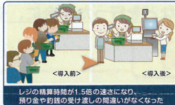
レジの精算時間が1.5倍の速さになり、預り金や釣銭の受け渡しの間違いがなくなった