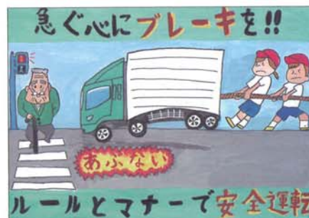
平成30年度 最優秀賞（高学年の部）