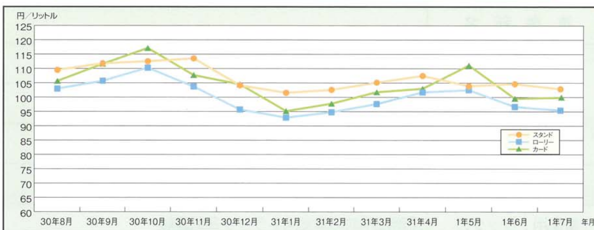
軽油価格推移グラフ (和歌山)