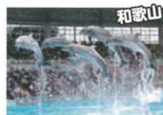
アドベンチャーワールド入園券 (家族4人分)

※本イベントは、特設サイト応募フォームよりご応募を受付しています。電子メール、FAX からのご応募は受付しておりません。 ※当選者の発表は、賞品の発送をもって代えさせていただきます。電話やメールでの当選結果のご質問にはお応えできませんので、ご了承ください。