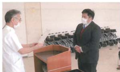
独立行政法人国立病院機構南和歌山医療センター

贈呈式は、青年協議会正副会長役員参加のもと執り行われ、施設より感謝の意をこめて感謝状が授与されました。