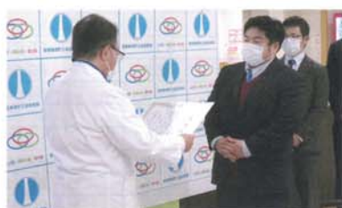
那智勝浦町立温泉病院