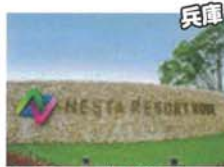
ネスタリゾート神戸内で使用できる金券