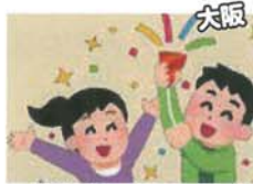
大阪府内のアトラクション券